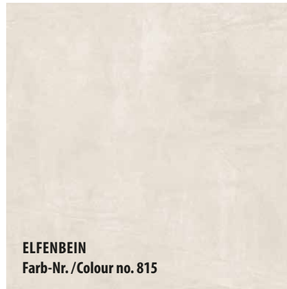
ELFENBEIN Farb-Nr./Colour no. 815