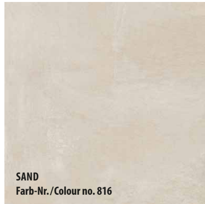
SAND Farb-Nr./Colour no. 816