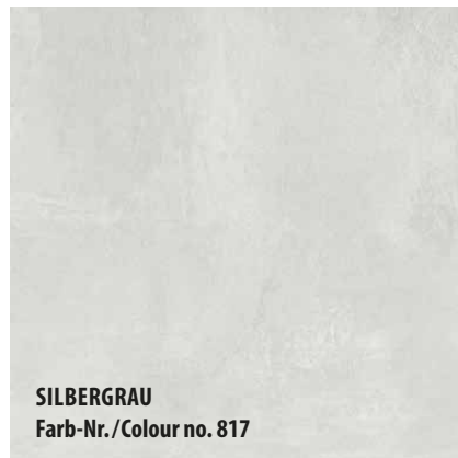
SILBERGRAU Farb-Nr./Colour no. 817