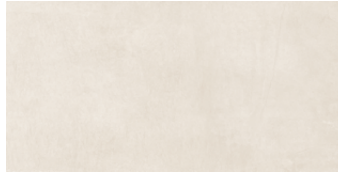
1200 x 600 x 6 mm | 1197 x 597 x 6 mm Art.-Nr./Art. no. 81 120060 815 · PG* 968

Boden- und Wandfliesen, Sockelleiste/Floor and wall tiles, skirting