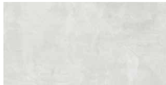
1200 x 600 x 6 mm | 1197 x 597 x 6 mm Art.-Nr./Art. no. 81 120060 817 · PG* 968

Boden- und Wandfliesen, Sockelleiste/Floor and wall tiles, skirting